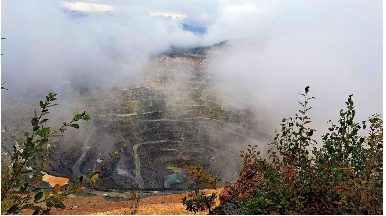
„Rana Litosferică” a carierei de minereu cuprifera de la Roșia Poieni