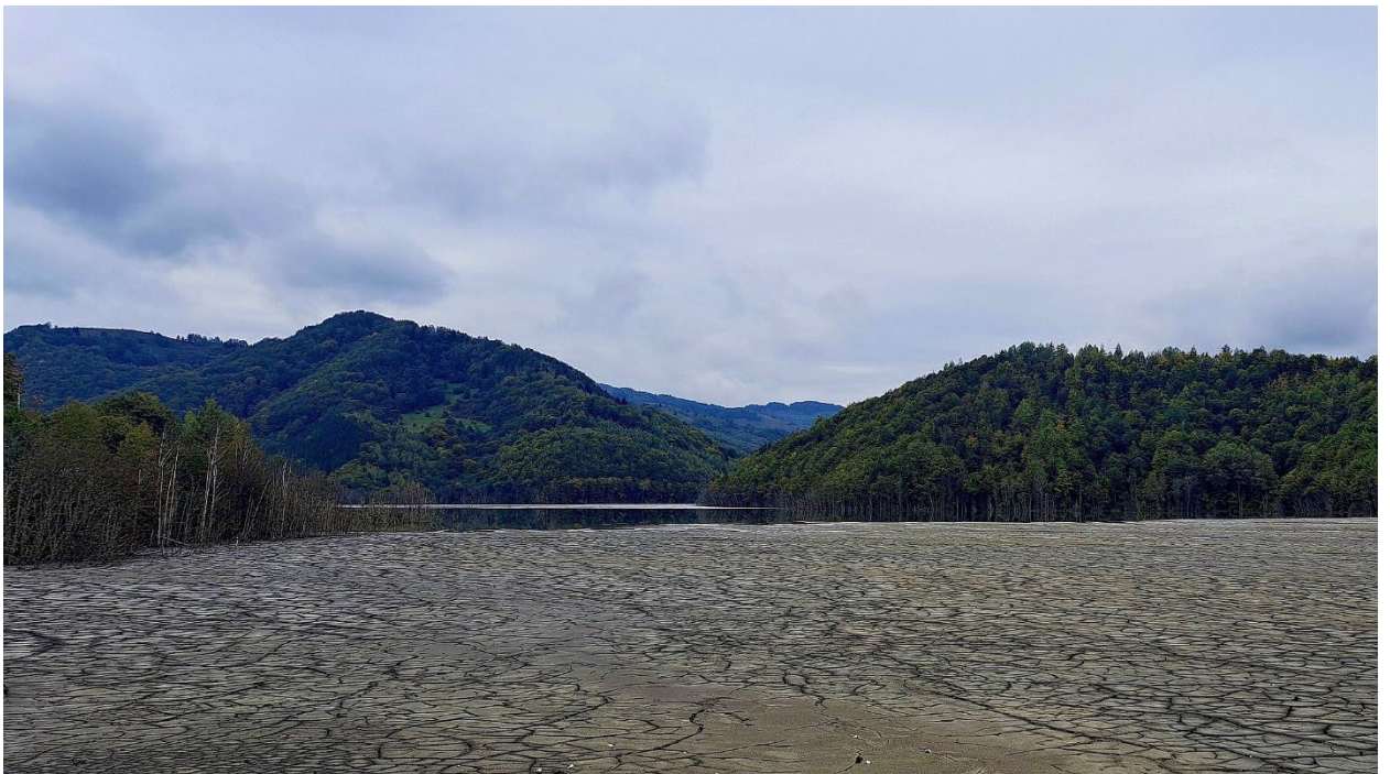
Iazul de decantare al sterilului de la Geamăna – Valea Șesii